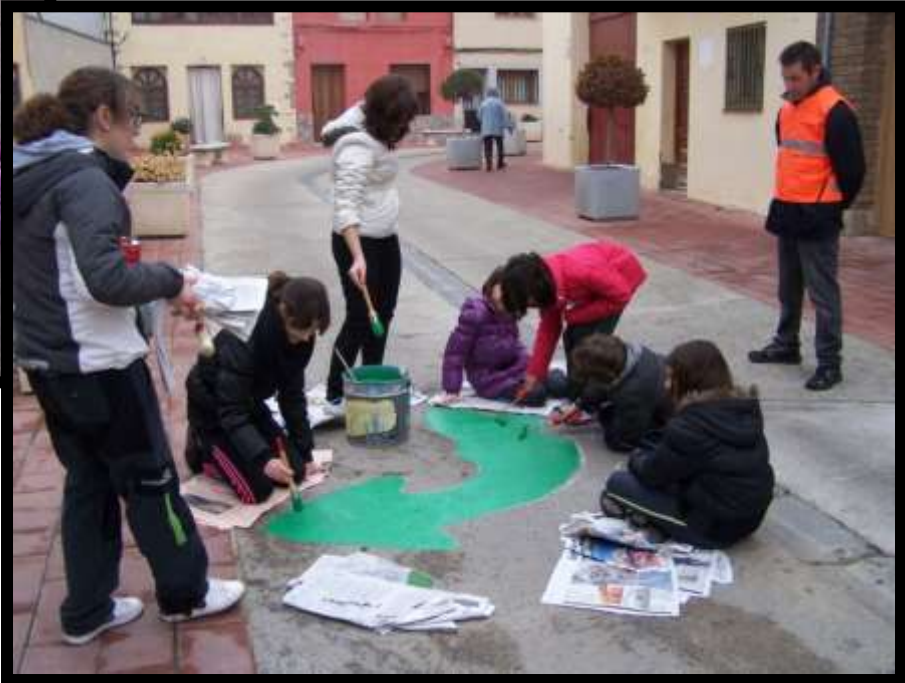
Preparando el camino